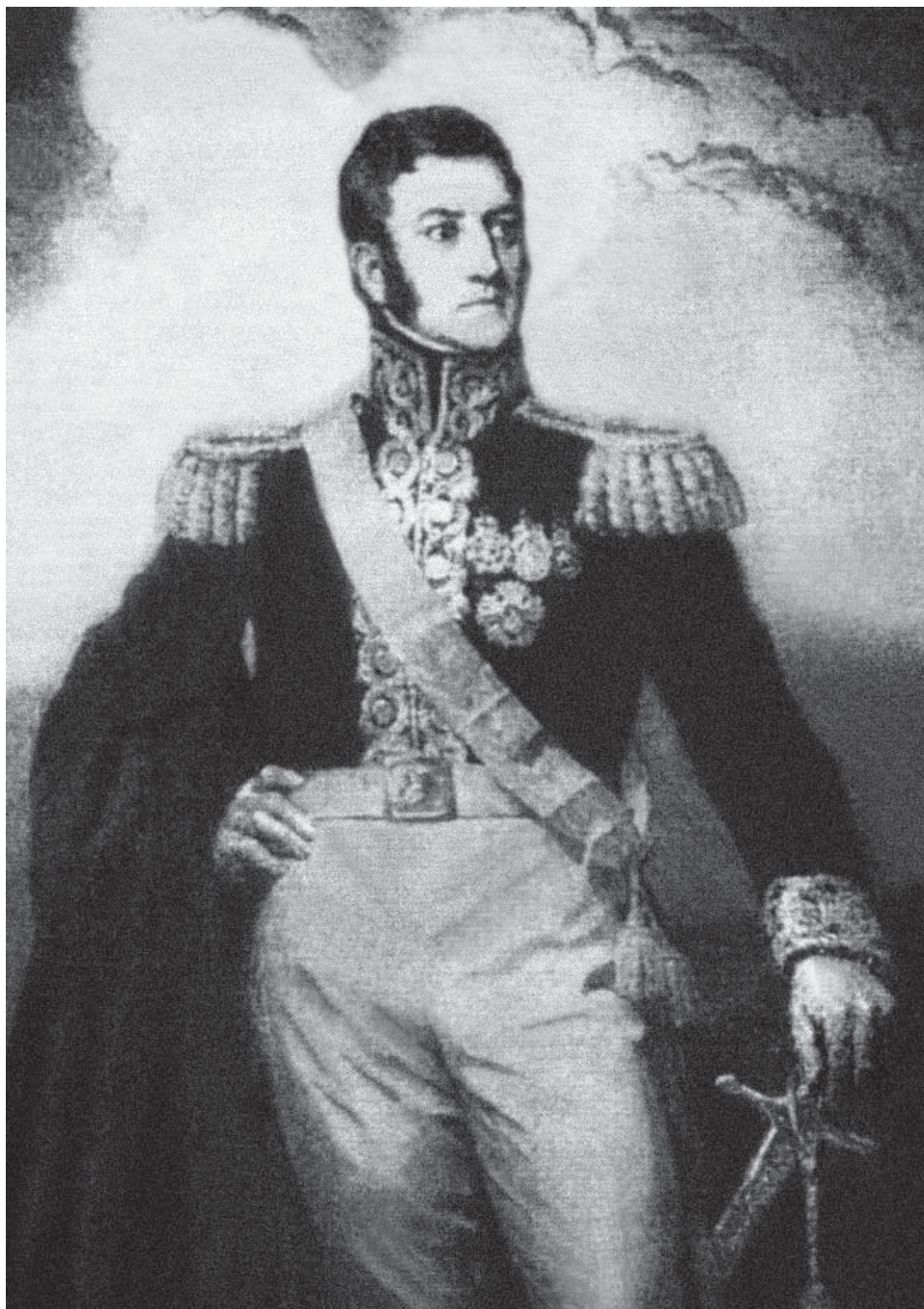
EL LIBERTADOR JOSÉ DE SAN MARTÍN