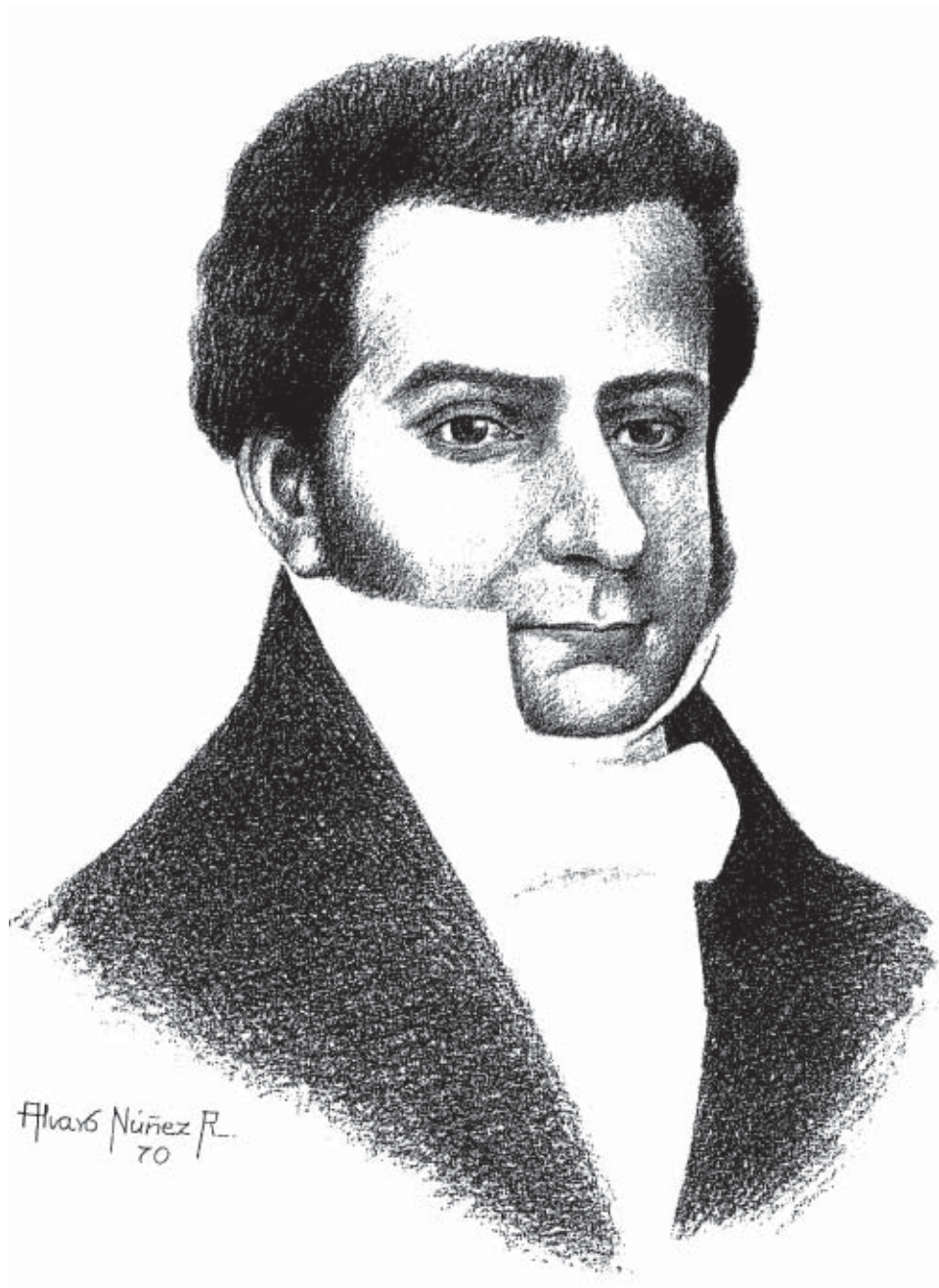
MANUEL LORENZO DE VIDAURRE (*)