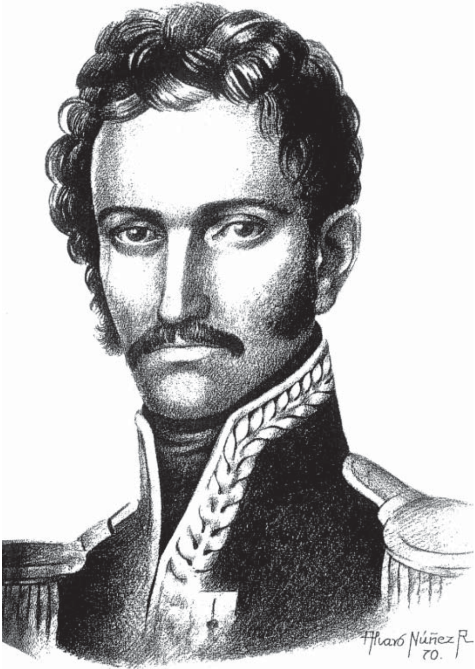
JOSÉ DE LA MAR (*)