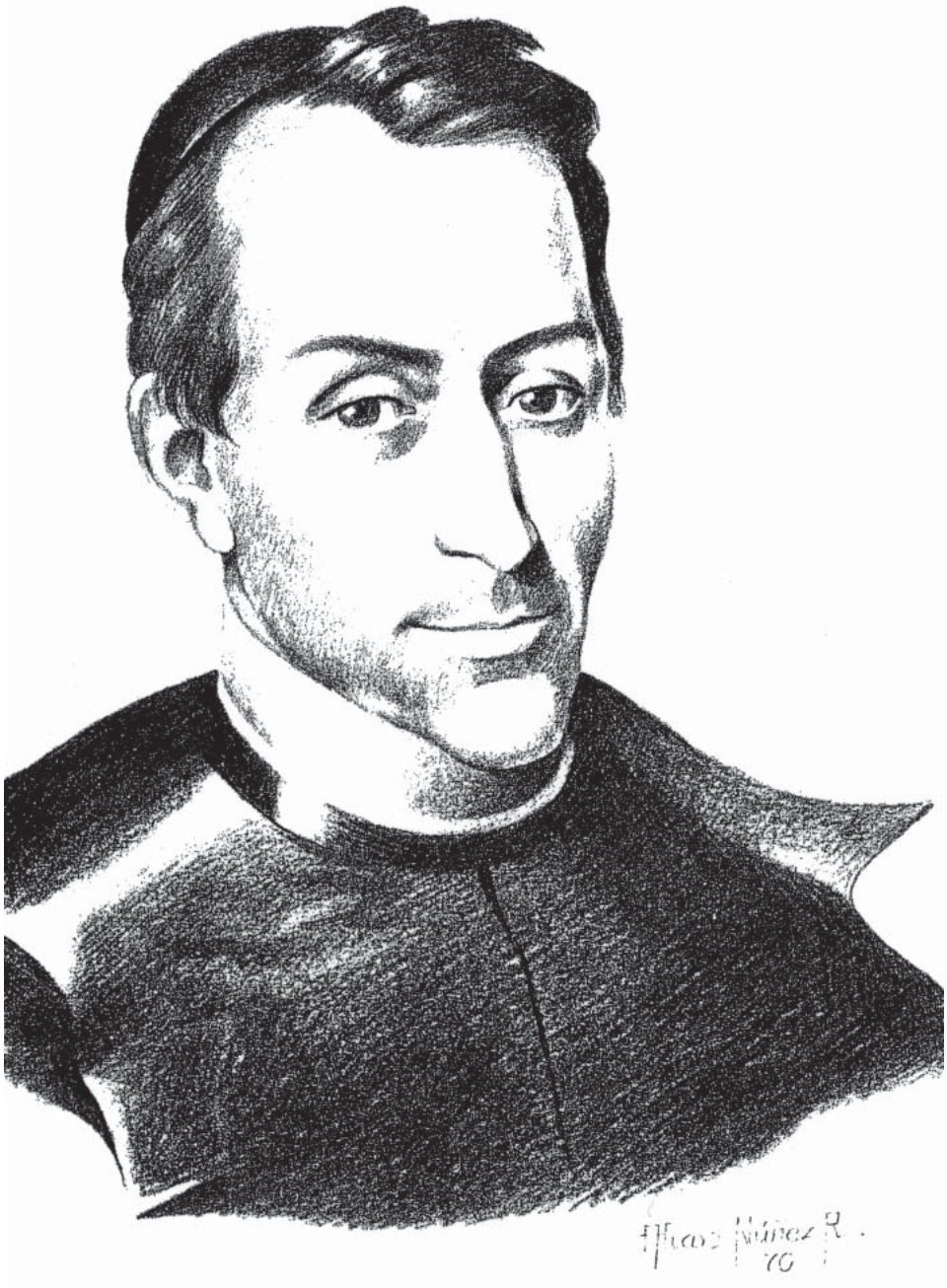
FRANCISCO JAVIER DE LUNA PIZARRO (*)