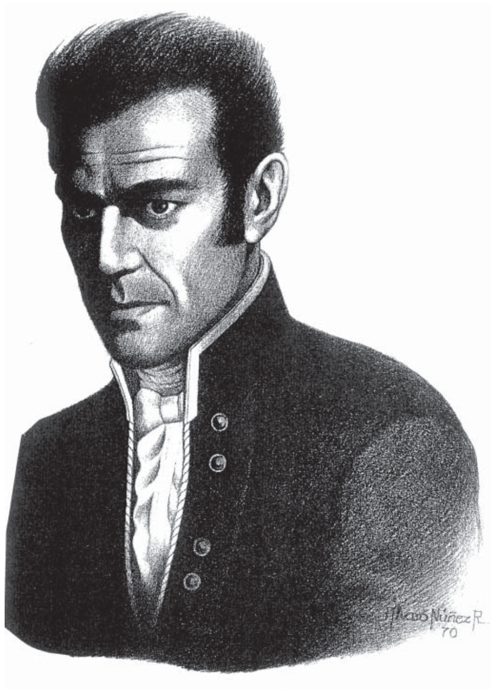
JOSÉ FAUSTINO SÁNCHEZ CARRIÓN (*)