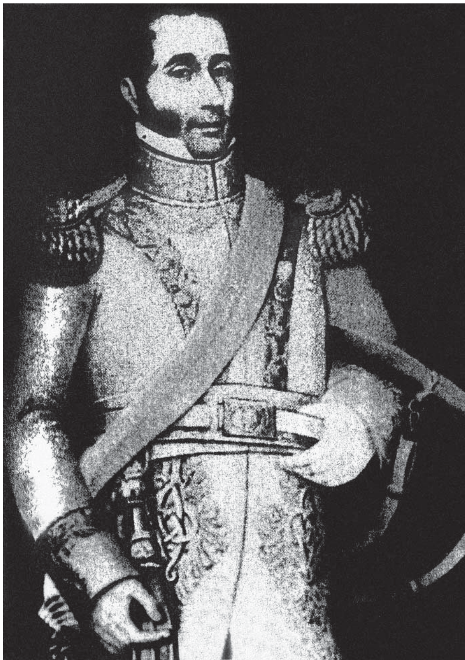
JOSÉ BERNARDO DE TAGLE Y PORTOCARRERO