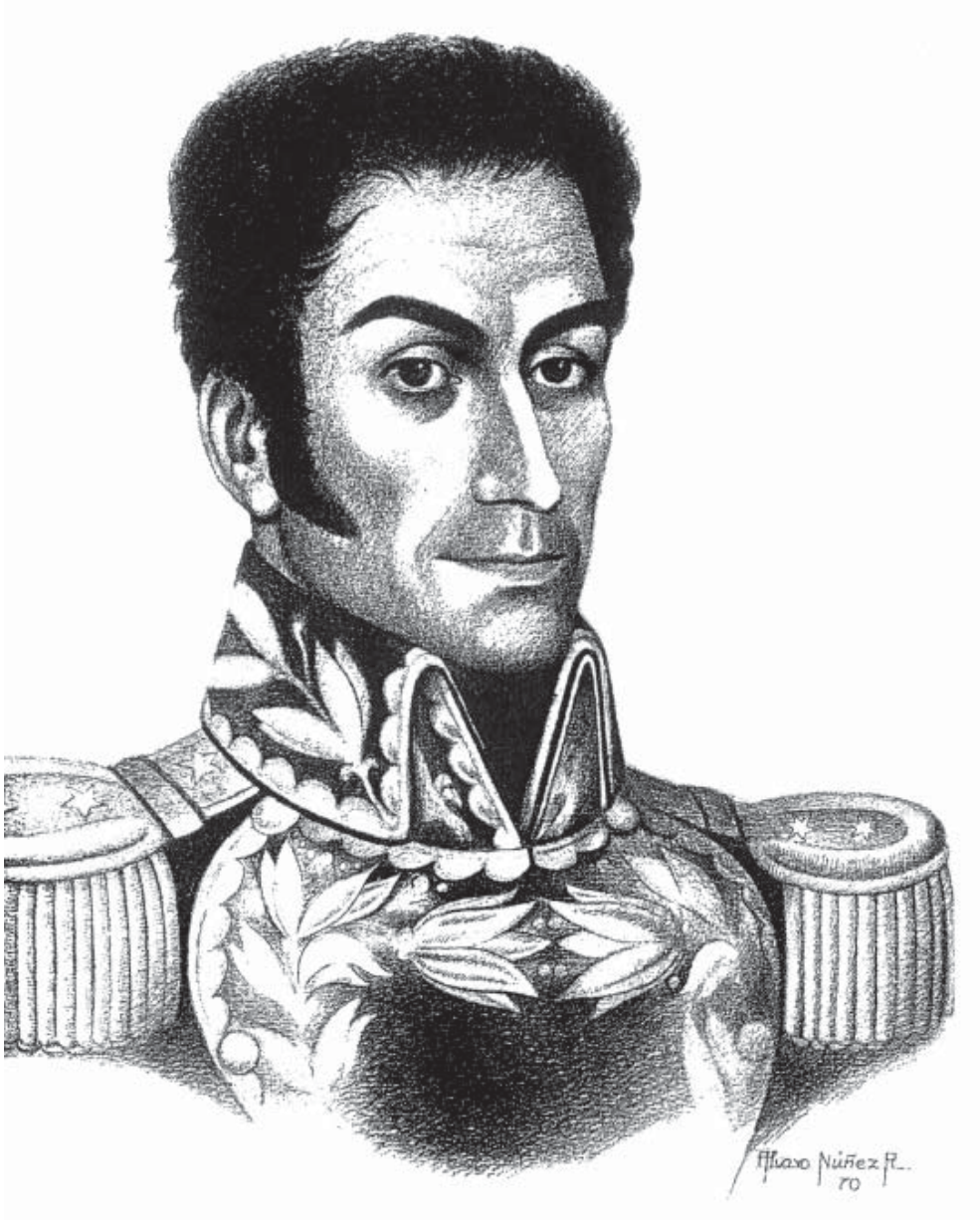
SIMÓN BOLÍVAR (*)