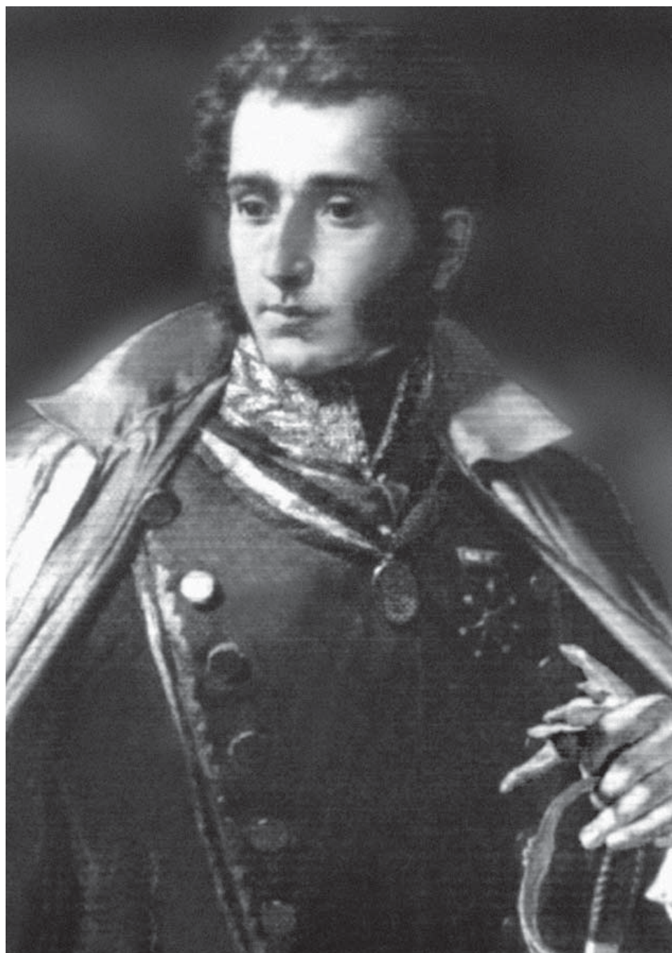
JOSÉ ANTONIO SUCRE